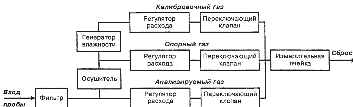
Рис. 2. Принципиальная схема анализатора влажности

Схема измерения влажности в анализаторах АМЕТЕК следующая (рис.2). Проба газа, отбираемая из общего потока, поступает в анализатор, где разделяется на два: опорный (проходит через осушитель на основе молекулярных сит) и анализируемый (поступает в измерительную ячейку). Система клапанов периодически переключает потоки, так что оба они поочередно подаются в ячейку на 30 с.